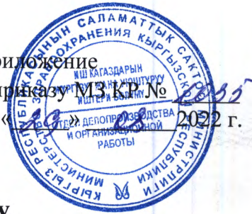
График дежурств по приему беременных женщин, рожениц, родильниц и новорожденных, подлежащих госпитализации в КРД № 2 г. Бишкек

Приложение к приказу МЗ КР № от « 22 » 09 2022 г.